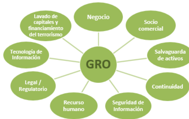
Figura 2: Enfoques considerados en la Gestión de Riesgo Operativo