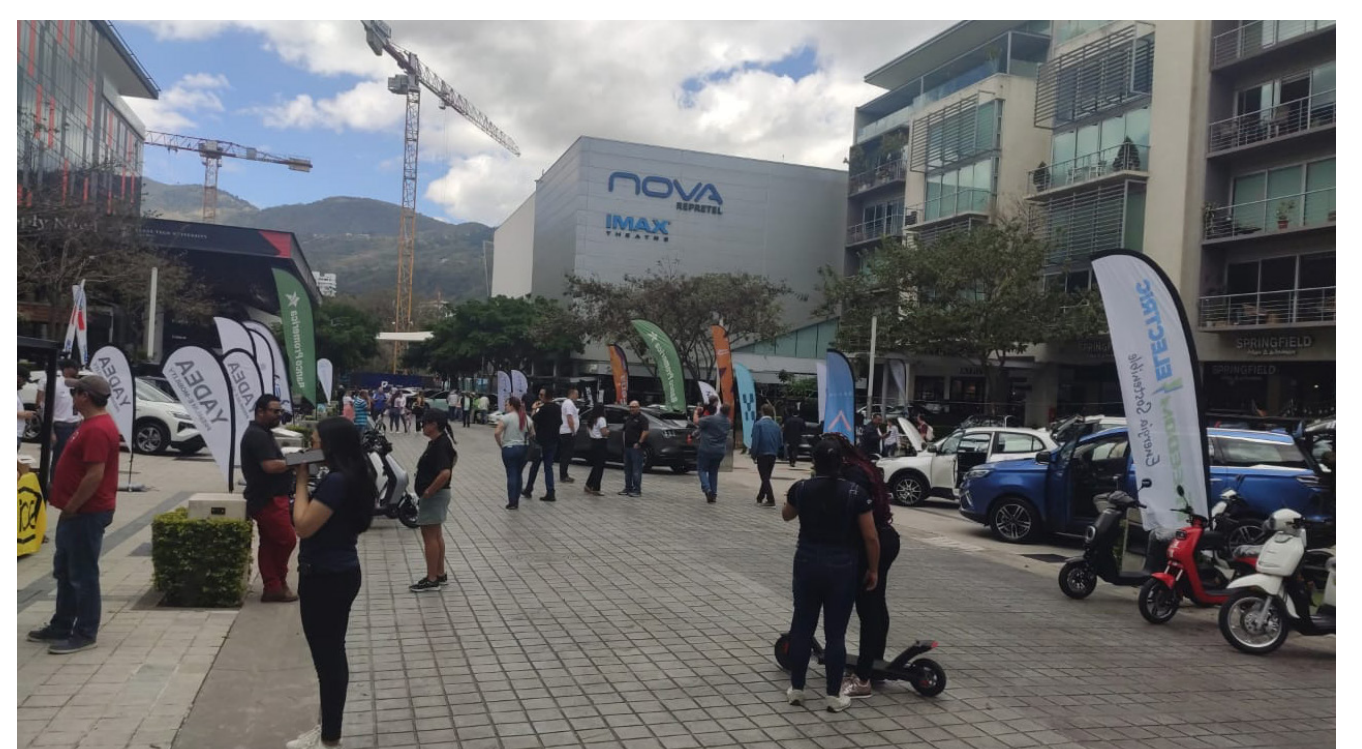
Primer Festival Ciudadano de Movilidad Eléctrica, organizado por la Asociación Costarricense de Movilidad Eléctrica (ASOMOVE)

Esta actividad fue de ingreso gratuito y se celebró en Avenida Escazú el sábado 25 y domingo 26 de febrero. Para Banco Promerica es muy importante apoyar este tipo de iniciativas que permitan descarbonizar el portafolio de crédito y acelerar la transición hacia la movilidad eléctrica libre de emisiones.